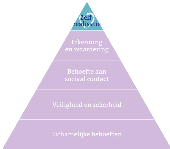
Piramide van Maslow